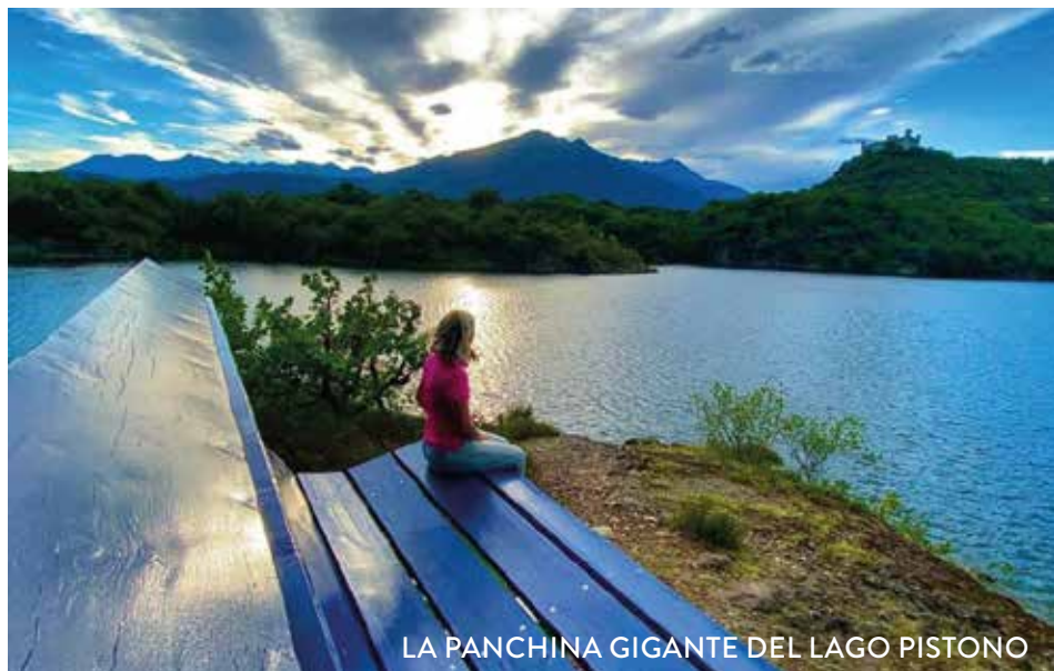
LA PANCHINA GIGANTE DEL LAGO PISTONO

DURANTE LA SAGRA È ATTIVO IL PUNTO DI INFORMAZIONE TURISTICA PRESSO LA LEA DEGLI ALPINI IN CORSO MARCONI